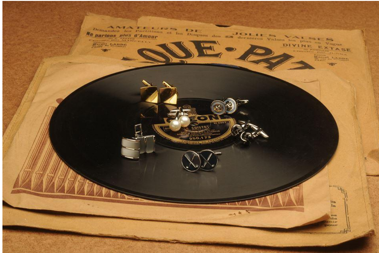
DE ZANT & ..Les boutons de manchettes...