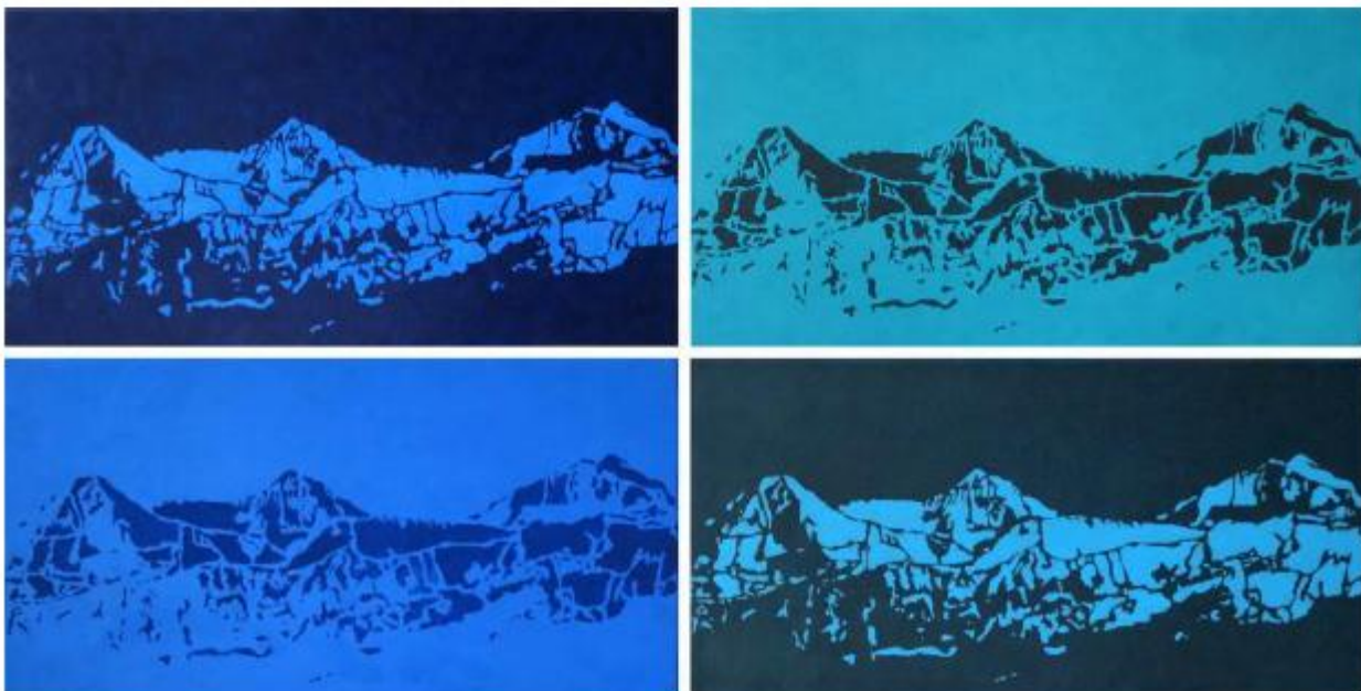
Pop Alp, 2013, 4 x 100 x 50 cm, huile sur toile